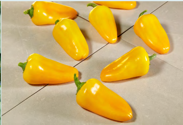
Lemon Delite F1 65-7186-UNT