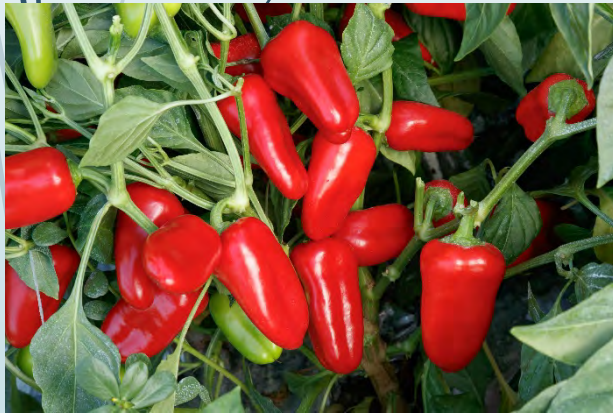
Ruby Delite F1 65-7185-UNT

Une nouvelle gamme de petits piments à manger en quelques bouchées, au goût vraiment supérieur.