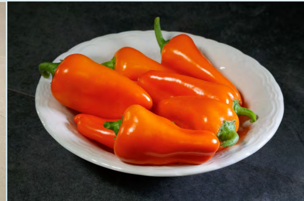
Orange Delite F1 65-7187-UNT